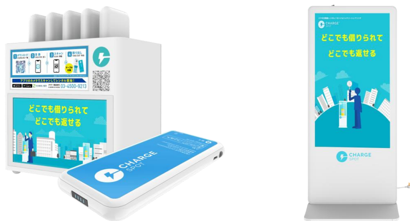
＜「ChargeSPOT」のバッテリースタンド＞

「ChargeSPOT」は多言語に対応しているため、増加し続ける訪日外国人観光客へのサービスの一環としても、活用が期待されます。また、大規模災害発生時は48時間無料で貸し出しが可能になり、緊急モバイルバッテリーとして活用することもできます。