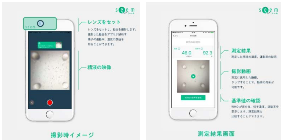
iPhone アプリによる測定イメージ

スマートフォンのアプリと専用キットを使って精子を撮るだけで精子の状態（濃度・運動率）を自分で確認できます。