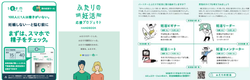
店頭リーフレットのイメージ

自宅で手軽に精子の濃度と運動率をセルフチェックできる『Seem』キットを、11月22日（いい夫婦の日）に向けて、本日11月19日より順次、北海道内のサツドラ167店舗で販売開始いたします。売り場には商品だけでなく、男性との妊活コミュニケーションをテーマにしたリーフレットを設置。夫婦間で前向きな妊活が行われる手助けを致します。